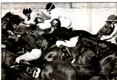
Priljeve igre: Vlasnici ne brinu o zdravlju konja

U borbi za materijalnu dobit, prestiž i slavu, mnogi sportisti posežu za nedozvoljenim stimulativnim sredstvima koja im omogućuju bolje, ponekad i vrhunske rezultate. Tako je i u konjičkom sportu. U želji da postignu što bolji rezultat, ili zbog straha od neuspeha, mnogi akteri nadmetanja na hipodromima taj cilj žele da ostvare dodavanjem zabranjenih supstanci kako bi na taj način uticali na mišićnu masu svojih grla, ne mareći