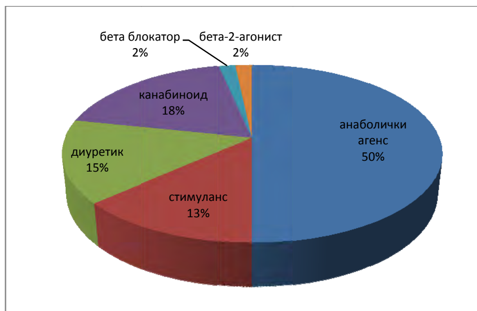
Графикон 3, проценат заступљености забрањених супстанци код позитивних спортиста