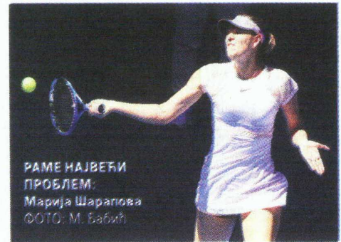
РАМЕ НАЈВЕЋИ ПРОБЛЕМ: Марија Шарапова

- Број 1 је атрактивнији када сте млади - свесна је да је за тај успех потребна констатност у дужем периоду што њој није једноставно. - Стално ми се враћа проблем са повредом рамена. То ме прати током целе каријере.