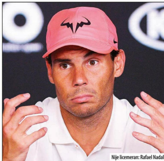
Nije licemeran: Rafael Nadal

Rafael Nadal je tokom finala AO opena radio ono što bi svako na njegovom mestu