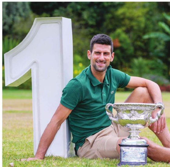
I zvanično najbolji igrač na svetu: Novak Đoković

Đoković je dodao da će nastup na predstojećim turnirima zavisiti od situacije sa povredom zadnje lože koja ga je mučila u prethodne tri nedelje. „Moram da snimim nogu, da vidim šta se dešava i u zavisnosti od toga, odlučiću da li idem u Dubai ili ne. Za sada sam prijavljen, ali videćemo da li ću se za nekoliko nedelja vratiti na teren. Dubai se igra u poslednjoj sedmici februara, nisam doneo konačnu odluku“, rekao je Đoković.